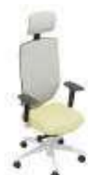
Composition 6 Dim : L. 65 x P. 62 x H. 46/122 cm