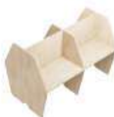
Composition 4 Dim : L. 206 x P. 130 cm