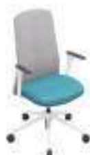
Composition 6 Dim : L. 63 x P. 53 x H. 47/105 cm