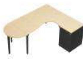
Composition 8 Dim : L. 245 x P. 162 cm

Retrouvez toutes les finitions disponibles de cette gamme sur www.spaceplanning.fr