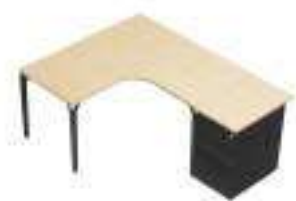
Composition 7 Dim : L. 182 x P. 140 cm