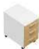
Complément 8 Dim : L. 40 x P. 60 cm

Retrouvez toutes les finitions disponibles de cette gamme sur www.spaceplanning.fr