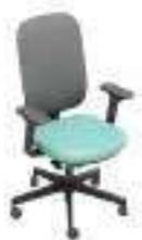
Composition 1 Dim : L. 68 x P. 59 x H. 48/103 cm

La gamme propose une version dossier tapissé ou résille, 3 mécanismes et 2 types d'accoudoirs.