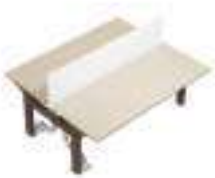
Composition 3 Dim : L. 200 x P. 170 x H. 65/125 cm