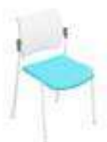
Composition 5 Dim : L. 51 x P. 54 x H. 45/81 cm