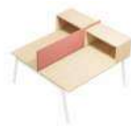
Composition 5 Dim : L. 160 x P. 160 cm