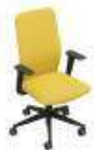
Composition 3 Dim : L. 65 x P. 55 x H. 49/100 cm