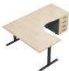
Composition 7 Dim : L. 202 x P. 160 cm