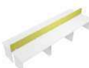
Composition 8 Dim : L. 480 x P. 160 cm

Retrouvez toutes les finitions disponibles de cette gamme sur www.spaceplanning.fr