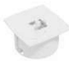
Composition 2 Dim : L. 11 x l. 11 x H. 0,25/5,7 cm