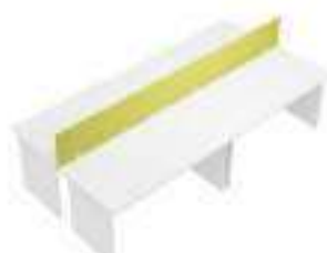
Composition 4 Dim : L. 320 x P. 160 cm