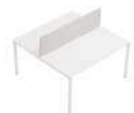
Composition 3 Dim : L. 140 x P. 140 cm