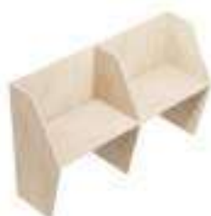
Composition 3 Dim : L. 206 x P. 65 cm