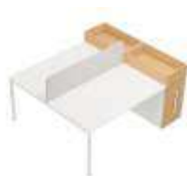
Composition 5 Dim : L. 182 x P. 160 cm