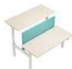
Composition 6 Dim : L. 180 x P. 169 x H. 65/125 cm