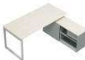
Composition 6 Dim : L. 180 x P. 160 cm