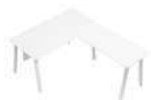
Composition 2 Dim : L. 160 x P. 200 cm