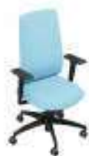
Composition 2 Dim : L. 67 x P. 52 x H. 44/104 cm