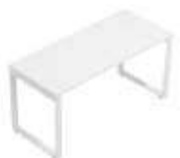
Composition 1 Dim : L. 140 x P. 60 cm

OGI Q possède un design linéaire pour un rendu sobre, adapté à tout type d'aménagement, en home office comme en open-space. Le poste peut être équipé de diverses options dont un écran acoustique, apportant encore plus de fonctionnalité et d'ergonomie à l'espace de travail.