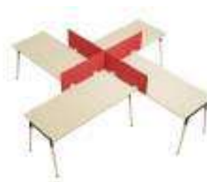
Composition 8 Dim : (4x) L. 180 x P. 80 cm

Retrouvez toutes les finitions disponibles de cette gamme sur www.spaceplanning.fr