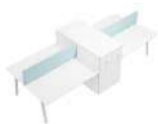
Composition 6 Dim : L. 400 x P. 164 cm