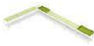
Composition 7 Dim : L. 452 x l. 286 x H. 58/64 cm