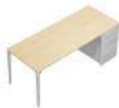
Composition 4 Dim : L. 202 x P. 80 cm