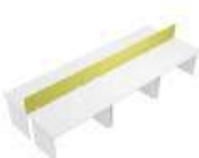
Composition 7 Dim : L. 420 x P. 160 cm