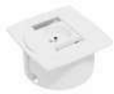
Composition 3 Dim : L. 11 x l. 11 x H. 0,25/5,7 cm