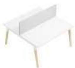
Composition 3 Dim : L. 140 x P. 143 cm