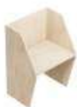
Composition 1 Dim : L. 84 x P. 65 cm

MAC-CALL est une collection pour meubler facilement les centres d'appel grâce à une structure modulable permettant de créer des postes de travail à l'infini.