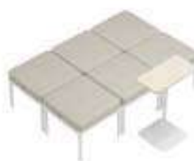
Composition 8 Dim : L. 180 x P. 120 x H. 45 cm

Retrouvez toutes les finitions disponibles de cette gamme sur www.spaceplanning.fr