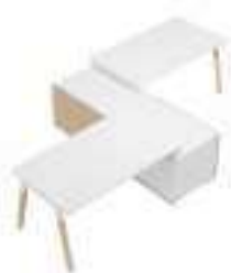
Composition 5 Dim : L. 320 x P. 180 cm