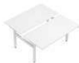
Composition 4 Dim : L. 160 x P. 169 x 65/130 cm