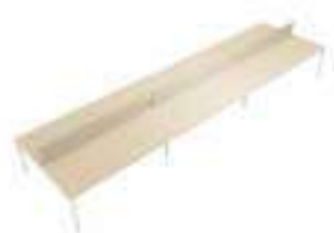
Composition 7 Dim : L. 600 x P. 163 cm