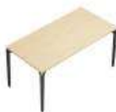
Composition 2 Dim : L. 160 x P. 80 cm