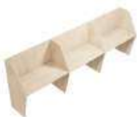
Composition 5 Dim : L. 368 x P. 65 cm