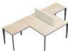
Composition 5 Dim : L. 140 x P. 286 cm