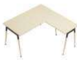
Composition 2 Dim : L. 160 x P. 160 cm