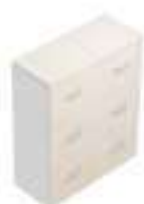
Complément 8 Dim : L. 100 x P. 43 x H. 112 cm

Retrouvez toutes les finitions disponibles de cette gamme sur www.spaceplanning.fr