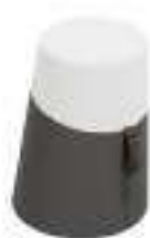
Composition 1 Dim : \varnothing 38/32 x H. 51 cm

KULBU est un concept innovant d'assise et mobilier multifonction pensé pour répondre au développement du travail en mode projet, aux méthodes agiles et autres design thinking doublé d'une volonté de proposer une gamme utilisant des matériaux bio-sourcés.