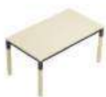
Composition 1 Dim : L. 140 x P. 80 cm

Avec ses pieds en métal et bois, la gamme X4 est la garantie d'un duo sobre et dynamique. Ce mélange de finitions lui confère une touche distinctive sur votre lieu de travail.