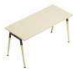
Composition 1 Dim : L. 140 x P. 60 cm

X3 est une table iconique au caractère moderne : sa structure légère et linéaire est parfaite pour les intérieurs ordonnés débordant d'énergie. Sa particularité réside dans ses pieds coniques sobres, disponibles en bois et en métal. Le plateau est personnalisable avec une sélection de différents bois de mélamine : du blanc à l'orme, en passant par le noyer, le chêne et la finition innovante en ciment.