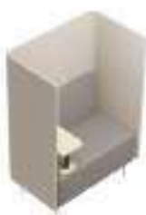
Composition 1 Dim : L. 107 x P. 65 x H. 135 cm

NUCLEO est une collection complète de mobilier pour les espaces communs, attente, lounge, mais aussi pour réunions et nouvelles typologies de postes de travail. La force de cette gamme est la flexibilité des articles et la personnalisation de tous les éléments, afin de créer un véritable espace sur mesure.