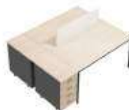
Composition 4 Dim : L. 203 x P. 164 cm