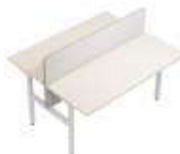
Composition 6 Dim : L. 200 x P. 169 x 65/130 cm