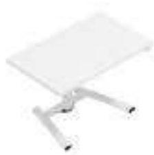
Composition 7 Dim : L. 100 x P. 60 x 65/130 cm