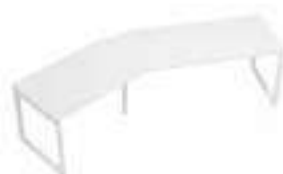
Composition 8 Dim : L. 300 x P. 80 cm

Retrouvez toutes les finitions disponibles de cette gamme sur www.spaceplanning.fr