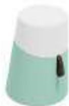
Composition 4 Dim : \varnothing 38/32 x H. 51 cm