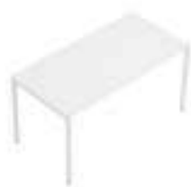
Composition 2 Dim : L. 160 x P. 80 cm