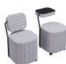
Composition 6 Dim : L. 49 x l. 54 x H. 50 cm