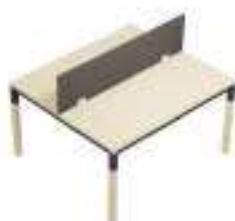
Composition 3 Dim : L. 140 x P. 124 cm