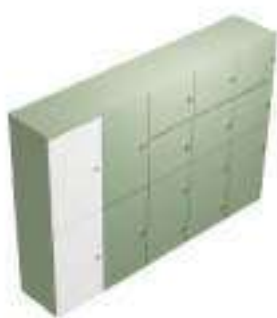
Composition 1 Dim : L. 225 x P. 43,4 x H. 157 cm

GALAXY LOCKER est une gamme d'armoires avec portes battantes équipées de serrures spéciales destinées au rangement de documents ou d'objets personnels sur le lieu de travail. Les portes peuvent par ailleurs être équipées d'une fente permettant l'insertion de documents.