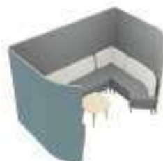
Composition 8 Dim : L. 290 x P. 190 x H. 135 cm

Retrouvez toutes les finitions disponibles de cette gamme sur www.spaceplanning.fr