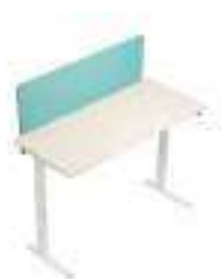
Composition 3 Dim : L. 180 x P. 80 x H. 65/125 cm