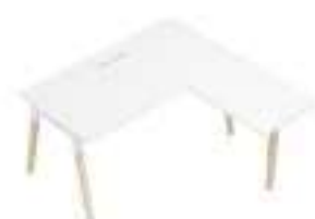
Composition 2 Dim : L. 160 x P. 160 cm