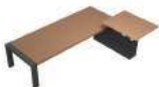
Composition 3 Dim : L. 330 x l. 240 x H. 67/130 cm