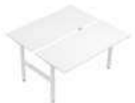
Composition 5 Dim : L. 180 x P. 169 x 65/130 cm