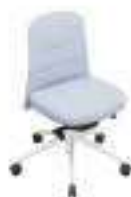
Composition 2 Dim : L. 53 x P. 53 x H. 47/89 cm