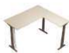
Composition 2 Dim : L. 200 x l. 190 x H. 65/125 cm