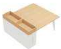
Composition 5 Dim : L. 182 x P. 160 cm