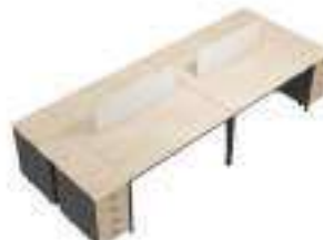
Composition 6 Dim : L. 406 x P. 164 cm