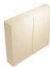
Composition 8 Dim : L. 240 x P. 46 x H. 196 cm

Retrouvez toutes les finitions disponibles de cette gamme sur www.spaceplanning.fr