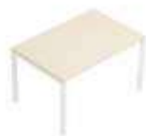
Composition 1 Dim : L. 120 x P. 80 cm

Le système pratique de fixation par ressort fait d'ITALO FORTY une structure solide, fiable et durable.