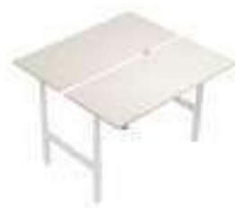
Composition 5 Dim : L. 180 x P. 168 x H. 60,2/125,2 cm