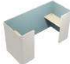
Composition 6 Dim : L. 268 x P. 117 x H. 135 cm