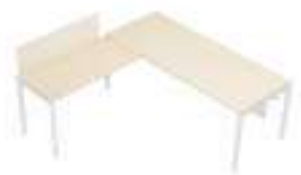
Composition 3 Dim : L. 200 x P. 200 cm