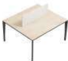
Composition 3 Dim : L. 140 x P. 124 cm