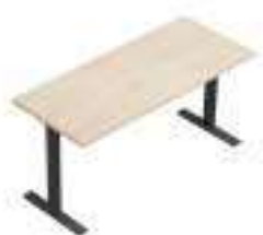
Composition 1 Dim : L. 140 x P. 60 cm

Le système modulaire IDEA + TUBE permet une multitude de compositions et une excellente optimisation de l'espace. Créer un intérieur sur mesure est possible et simple : il peut devenir un bureau autonome ou peut être assemblé pour former un système de postes de travail partagés pratiques et fonctionnels, également personnalisables dans les tailles et les finitions.