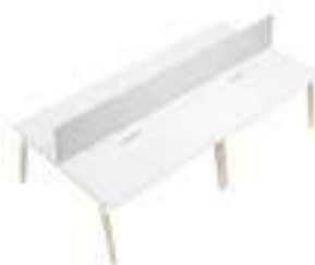
Composition 4 Dim : L. 320 x P. 163 cm