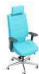
Composition 3 Dim : L. 68 x P. 60 x H. 48/127 cm