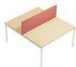
Composition 3 Dim : L. 140 x P. 160 cm