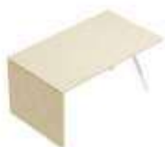
Composition 1 Dim : L. 140 x P. 80 cm

EKOMPI est un système conçu pour organiser le bureau avec des solutions multiples : plans traditionnels, ergonomiques et tables de bureau « corner » sur bases avec joue en bois ou en métal.