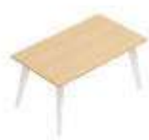
Composition 1 Dim : L. 140 x P. 80 cm

PIGRECO est un système de bureaux très innovant qui rompt avec les structures conventionnelles. Conçu pour aménager tous vos lieux de travail directionnels, opératifs et de réunions, ce mobilier saura vous accompagner quel que soit vos espaces.