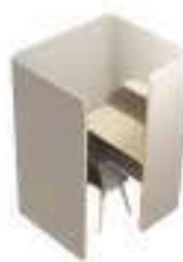
Composition 2 Dim : L. 137 x P. 117 x H. 175 cm