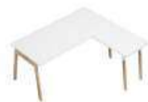
Composition 4 Dim : L. 180 x P. 160 cm