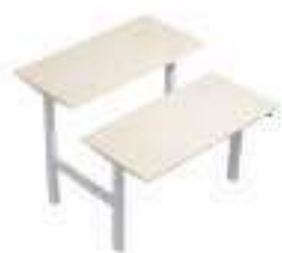
Composition 5 Dim : L. 160 x P. 169 x H. 65/125 cm