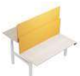
Composition 5 Dim : L. 180 x P. 160 x H. 65/130 cm