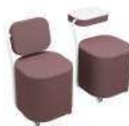
Composition 2 Dim : L. 49 x l. 54 x H. 50 cm