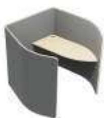
Composition 1 Dim : L. 150 x P. 138 x H. 135 cm

Nucleo est une collection complète de mobilier pour les espaces communs, attente, lounge, mais aussi pour réunions et nouvelles typologies de postes de travail. La force de cette gamme est la flexibilité des articles et la personnalisation de tous les éléments, afin de créer un véritable espace sur mesure.