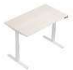
Composition 1 Dim : L. 140 x P. 80 x H. 65/130 cm

Le design de la table Flex'Up est aussi personnalisable avec son plateau ovale disponible en plusieurs coloris pour s'adapter à n'importe quelle salle de réunion.