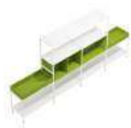
Composition 1 Dim : L. 230 x P. 40 x H. 133 cm

CONCERTO est un système modulaire permettant de composer de espaces de travail fonctionnels. De nombreuses configurations sont possibles afin de créer un environnement de travail adapté à n'importe quels types d'espaces.