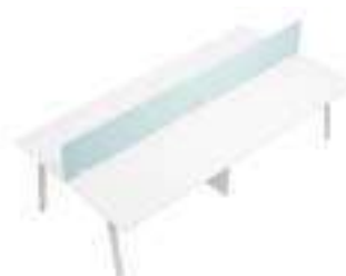
Composition 4 Dim : L. 320 x P. 164 cm