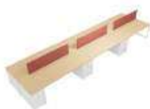
Composition 7 Dim : L. 600 x P. 160 cm