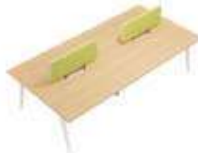
Composition 4 Dim : L. 320 x P. 160 cm