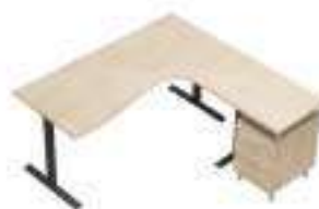
Composition 8 Dim : L. 180 x P. 180 cm

Retrouvez toutes les finitions disponibles de cette gamme sur www.spaceplanning.fr