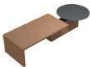
Composition 1 Dim : L. 328 x P. 120 x H. 67/130 cm

La collection KYO comprend une proposition Sit to Stand. Le plateau réglable en hauteur peut être utilisé comme surface de travail ou comme plan de réunion pour accueillir les visiteurs. Toutes les solutions présentées sont également disponibles en configuration fixe.