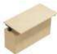
Composition 5 Dim : L. 122,5 x P. 60 x H. 65/130 cm