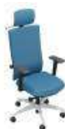
Composition 3 Dim : L. 65 x P. 62 x H. 46/122 cm