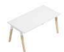
Composition 1 Dim : L. 140 x P. 70 cm

DIALOGUE s'inscrit dans les open spaces comme dans les espaces de coworking, faisant de cette gamme de mobilier une réponse idéale à tous les aménagements d'espaces de travail.