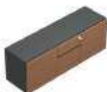
Complément 5 Dim : L. 143 x P. 42 x H. 53,8 cm