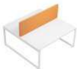
Composition 7 Dim : L. 160 x P. 161 cm