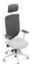
Composition 5 Dim : L. 65 x P. 62 x H. 46/122 cm