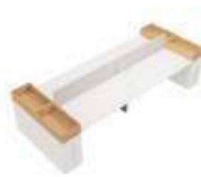
Composition 6 Dim : L. 404 x P. 160 cm