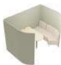
Composition 6 Dim : L. 265 x P. 190 x H. 175 cm