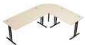
Composition 5 Dim : L. 200 x P. 260 x H. 64/86 cm