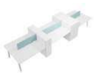
Composition 8 Dim : L. 600 x P. 164 cm

Retrouvez toutes les finitions disponibles de cette gamme sur www.spaceplanning.fr