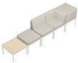
Composition 3 Dim : L. 300 x P. 60 x H. 45/75 cm