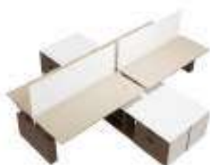
Composition 6 Dim : L. 410 x l. 380 x H. 65/125 cm