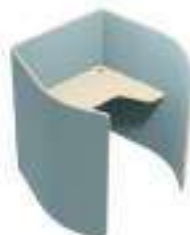
Composition 2 Dim : L. 150 x P. 138 x H. 135 cm