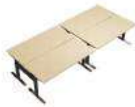
Composition 4 Dim : L. 369 x P. 164 x H. 65/130 cm