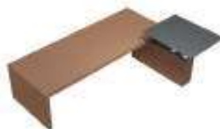
Composition 2 Dim : L. 330 x l. 240 x H. 67/130 cm