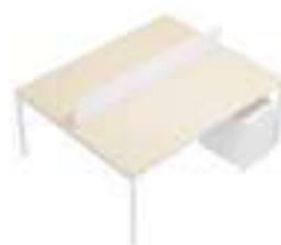
Composition 4 Dim : L. 200 x P. 163 cm