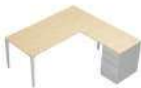
Composition 3 Dim : L. 180 x P. 180 cm