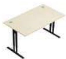
Composition 1 Dim : L. 140 x P. 80 x H. 64/86 cm

La gamme ESSENTIEL est la solution naturelle pour les entreprises en mouvement, à la recherche d'un mobilier polyvalent et robuste au meilleur budget. Conçu selon 2 modèles de structures, poutre ou voile de fond structurel, ce modèle offre une large capacité de réponse aux projets d'agencement les plus variés.