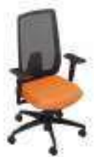
Composition 5 Dim : L. 67 x P. 52 x H. 44/104 cm