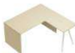
Composition 2 Dim : L. 160 x P. 160 cm