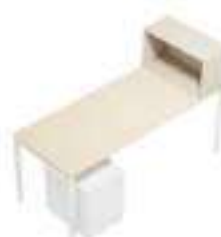
Composition 2 Dim : L. 200 x P. 80 cm