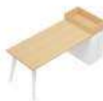
Composition 2 Dim : L. 202 x P. 80 cm