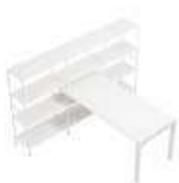
Composition 4 Dim : L. 247 x P. 40 x H. 133 cm