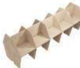
Composition 8 Dim : L. 412 x P. 130 cm

Retrouvez toutes les finitions disponibles de cette gamme sur www.spaceplanning.fr