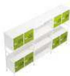
Composition 8 Dim : L. 247 x P. 40 x H. 133 cm

Retrouvez toutes les finitions disponibles de cette gamme sur www.spaceplanning.fr