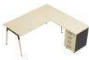
Composition 3 Dim : L. 180 x P. 180 cm