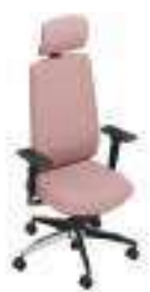
Composition 3 Dim : L. 67 x P. 52 x H. 44/124 cm