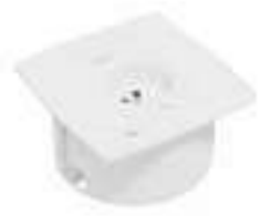
Composition 7 Dim : L. 11 x l. 11 x H. 0,25/5,7 cm