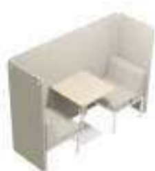
Composition 1 Dim : L. 186 x P. 63 x H. 45/140 cm

Son concept, sa construction et son système de fixation sont simples et astucieux.