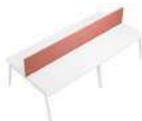
Composition 4 Dim : L. 320 x P. 160 cm