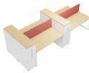
Composition 6 Dim : L. 400 x P. 160 cm