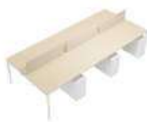
Composition 6 Dim : L. 360 x P. 163 cm