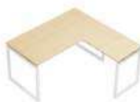
Composition 2 Dim : L. 160 x P. 160 cm