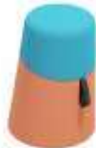
Composition 5 Dim : \varnothing 38/32 x H. 51 cm