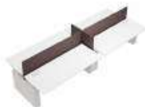
Composition 4 Dim : L. 410 x P. 170 x H. 65/125 cm