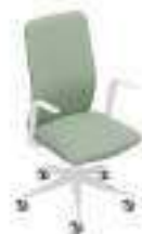
Composition 2 Dim : L. 61 x P. 55 x H. 49/100 cm