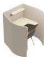
Composition 4 Dim : L. 150 x P. 138 x H. 135 cm