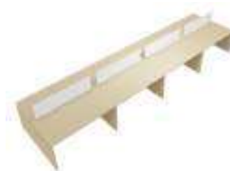
Composition 8 Dim : L. 640 x P. 160 cm

Retrouvez toutes les finitions disponibles de cette gamme sur www.spaceplanning.fr