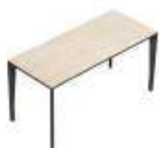
Composition 1 Dim : L. 140 x P. 60 cm

L'ordre, la concentration et l'essentialité sont les trois éléments inspirants pour la conception de cette collection de bureau raffinée X5. Les lignes pures et les formes géométriques exaltent la fonctionnalité et l'esthétique de la table, pour une composition flexible et une personnalisation polyvalente.