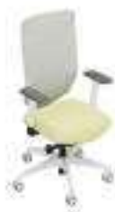
Composition 4 Dim : L. 65 x P. 62 x H. 46/108 cm