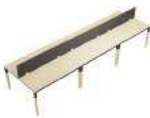
Composition 7 Dim : L. 420 x P. 124 cm