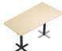
Composition 6 Dim : L. 220 x P. 100/120 x H. 65/130 cm