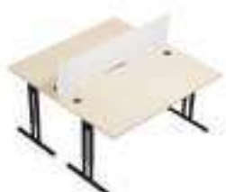
Composition 3 Dim : L. 160 x P. 164 x H. 64/86 cm