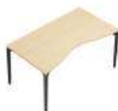
Composition 6 Dim : L. 160 x P. 90 cm