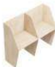
Composition 2 Dim : L. 166 x P. 65 cm