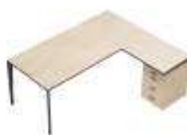
Composition 2 Dim : L. 200 x P. 170 cm