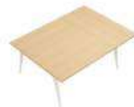
Composition 8 Dim : L. 220 x P. 160 cm

Retrouvez toutes les finitions disponibles de cette gamme sur www.spaceplanning.fr