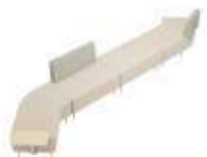
Composition 7 Dim : L. 445 x l. 131 x H. 45/80 cm