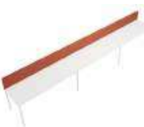
Composition 8 Dim : L. 600 x P. 80 cm

Retrouvez toutes les finitions disponibles de cette gamme sur www.spaceplanning.fr