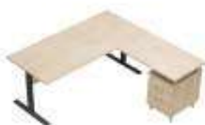
Composition 3 Dim : L. 180 x P. 180 cm