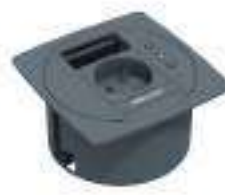
Composition 8 Dim : L. 11 x l. 11 x H. 0,25/5,7 cm

Retrouvez toutes les finitions disponibles de cette gamme sur www.spaceplanning.fr