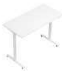
Composition 2 Dim : L. 160 x P. 80 x 65/130 cm