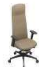
Composition 4 Dim : L. 66 x P. 53 x H. 47/127 cm