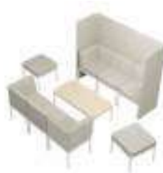
Composition 2 Dim : L. 187 x l. 250 x H. 45/140 cm