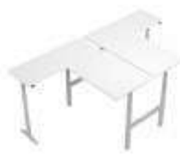
Composition 6 Dim : L. 180 x P. 328 x H. 60,2/125,2 cm