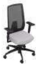
Composition 4 Dim : L. 67 x P. 52 x H. 44/104 cm