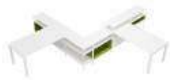
Composition 5 Dim : L. 247 x P. 40 x H. 74/94 cm (2x)