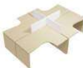
Composition 4 Dim : L. 322 x P. 242 cm