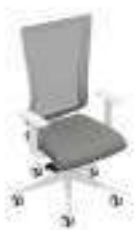
Composition 5 Dim : L. 65 x P. 52 x H. 44/102 cm