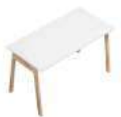
Composition 2 Dim : L. 140 x P. 70 cm