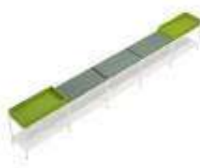
Composition 2 Dim : L. 412 x P. 40 x H. 58/64 cm