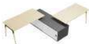
Composition 7 Dim : L. 342 x P. 181 cm