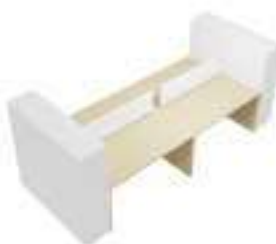
Composition 6 Dim : L. 400 x P. 160 cm