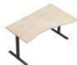
Composition 6 Dim : L. 160 x P. 100 cm