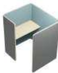
Composition 4 Dim : L. 117 x P. 137 x H. 135 cm