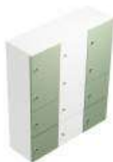
Composition 2 Dim : L. 135 x P. 43,4 x H. 157 cm