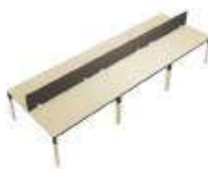
Composition 8 Dim : L. 480 x P. 124 cm

Retrouvez toutes les finitions disponibles de cette gamme sur www.spaceplanning.fr