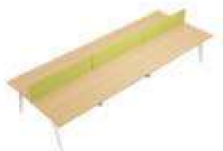
Composition 7 Dim : L. 420 x P. 160 cm