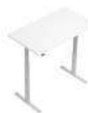
Composition 2 Dim : L. 140 x P. 80 x H. 61,8/126,8 cm