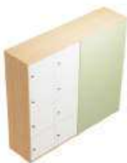
Composition 3 Dim : L. 183 x P. 45,4 x H. 157 cm