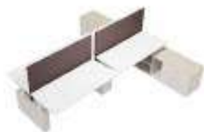
Composition 5 Dim : L. 370 x l. 380 x H. 65/125 cm