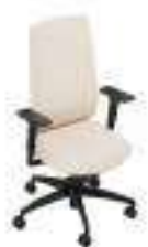
Composition 1 Dim : L. 67 x P. 52 x H. 44/104 cm

INDEED satisfait les exigences d'une nouvelle génération avant tout sur un point: la légèreté ! Son design effilé, épuré, est un véritable partenaire de jeu dans l'interaction avec les intérieurs les plus divers. Ses fonctions ergonomiques s'adaptent facilement en toute agilité aux besoins individuels du quotidien dynamique.