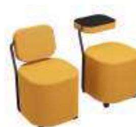
Composition 5 Dim : L. 49 x l. 54 x H. 50 cm