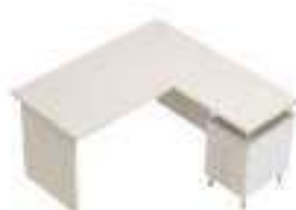
Composition 2 Dim : L. 160 x P. 160 cm