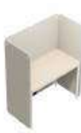
Composition 6 Dim : L. 125 x P. 63 x H. 45/140 cm