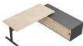
Composition 5 Dim : L. 224 x P. 181 cm