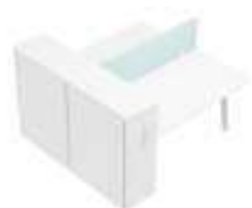
Composition 5 Dim : L. 180 x P. 164 cm