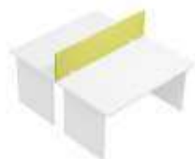
Composition 3 Dim : L. 140 x P. 160 cm