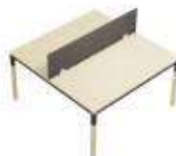
Composition 4 Dim : L. 160 x P. 164 cm