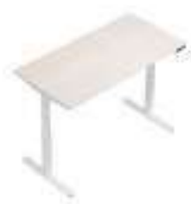
Composition 2 Dim : L. 160 x P. 80 x H. 65/130 cm