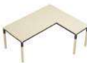
Composition 2 Dim : L. 200 x P. 170 cm