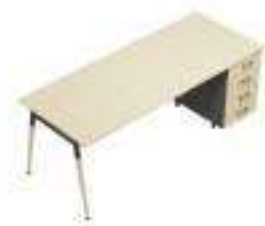
Composition 5 Dim : L. 202 x P. 80 cm