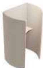
Composition 3 Dim : L. 130 x P. 100 x H. 200 cm