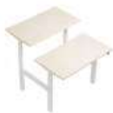
Composition 4 Dim : L. 140 x P. 169 x H. 65/125 cm