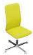
Composition 6 Dim : L. 53 x P. 55 x H. 49/100 cm