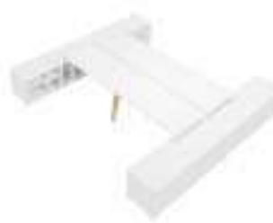
Composition 6 Dim : L. 360 x P. 420 cm