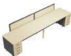
Composition 5 Dim : L. 364 x P. 80 cm