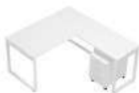
Composition 2 Dim : L. 160 x P. 180 cm