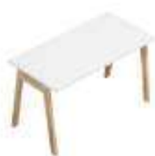
Composition 1 Dim : L. 160 x P. 60 cm

OGI B avec pieds en bois est une solution classique pour un lieu de travail moderne. L'aspect intemporel du bureau fait référence au design scandinave. Le piètement en bois de frêne naturel réchauffe l'espace qui l'entoure et l'on y retrouve toute la fonctionnalité de la série OGI. Un look minimaliste pour de nombreuses possibilités d'agencement, tant au bureau qu'à la maison, et offrant un espace de travail confortable.