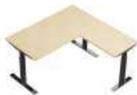
Composition 2 Dim : L. 160 x l. 60 x H. 65/130 cm