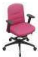
Composition 3 Dim : L. 66 x P. 53 x H. 47/89 cm