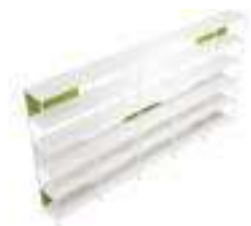
Composition 3 Dim : L. 412 x P. 40 x H. 213 cm