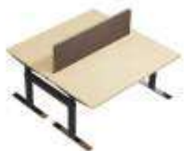
Composition 3 Dim : L. 160 x P. 164 x H. 65/130 cm