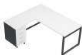
Composition 3 Dim : L. 160 x P. 180 cm