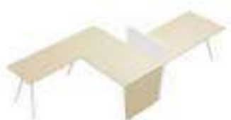
Composition 3 Dim : L. 342 x P. 160 cm