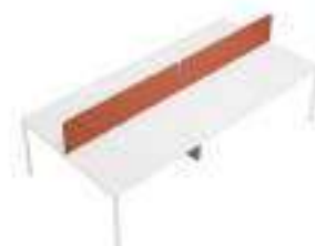
Composition 4 Dim : L. 320 x P. 160 cm