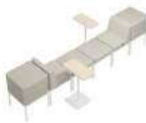
Composition 4 Dim : L. 360 x P. 60 x H. 45/75 cm