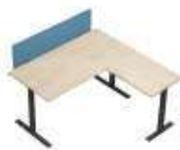
Composition 2 Dim : L. 160 x P. 160 cm