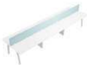
Composition 7 Dim : L. 420 x P. 124 cm