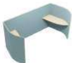
Composition 5 Dim : L. 296 x P. 138 x H. 135 cm