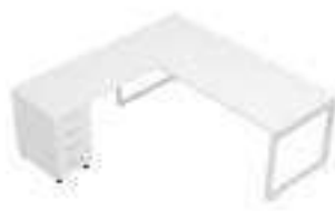
Composition 5 Dim : L. 200 x P. 200 cm