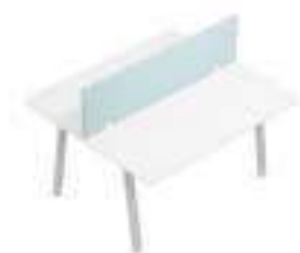
Composition 3 Dim : L. 140 x P. 124 cm