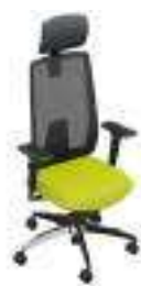
Composition 6 Dim : L. 67 x P. 52 x H. 44/124 cm