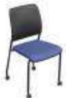
Composition 6 Dim : L. 47 x P. 59 x H. 49/87 cm