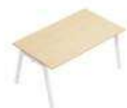
Composition 1 Dim : L. 140 x P. 80 cm

CINETIC est LA gamme de bureaux par excellence avec ses plans de travail simples ou face-à-face ainsi que ses nombreuses options ergonomiques et modulables.