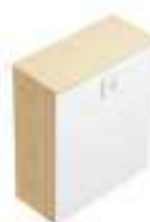
Complément 8 Dim : L. 100 x P. 45 x H. 113 cm

Retrouvez toutes les finitions disponibles de cette gamme sur www.spaceplanning.fr