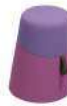
Composition 3 Dim : \varnothing 38/32 x H. 51 cm