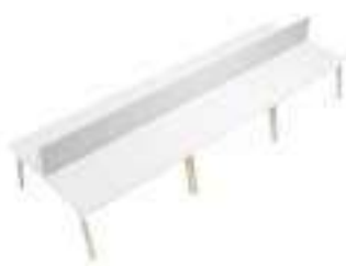
Composition 7 Dim : L. 480 x P. 163 cm