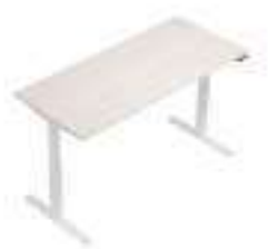
Composition 3 Dim : L. 180 x P. 80 x H. 65/130 cm