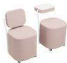
Composition 1 Dim : L. 49 x l. 54 x H. 50 cm

Modulable, confortable, ludique et élégant : ces quelques mots décrivent parfaitement le siège IQSEAT. Installez-vous confortablement contre le dossier de ce siège ou transformez-le en table afin d'y noter vos idées. La polyvalence des sièges à roulettes IQSEAT permet de les utiliser dans de nombreuses configurations différentes.