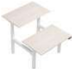
Composition 4 Dim : L. 120 x P. 160 x H. 65/130 cm