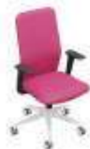
Composition 4 Dim : L. 65 x P. 55 x H. 49/100 cm