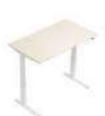
Composition 1 Dim : L. 140 x P. 80 x H. 65/125 cm

ALTIM+ est l'assurance d'une ergonomie optimale au bureau avec des postes réglables en hauteur électriquement. À l'aide d'un boîtier de commande sous le plateau vous pourrez varier la position assis ou debout à votre convenance.