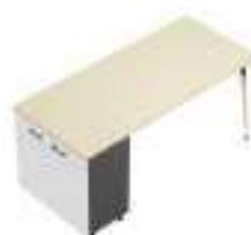
Composition 4 Dim : L. 182 x P. 80 cm