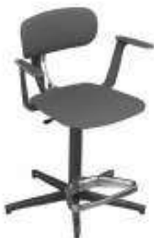
Composition 2 Dim : L. 61 x P. 43 x H. 52/85 cm