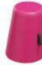
Composition 6 Dim : \varnothing 38/32 x H. 51 cm