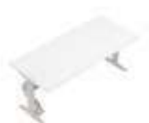
Composition 1 Dim : L. 200 x P. 90 x H. 65/125 cm

CRONO est une gamme de bureaux et de bench réglables en hauteur. L'élévation est contrôlée par un bouton-poussoir électronique situé sous le plan de travail. CRONO est également disponible dans une version programmable donnant la possibilité de mémoriser jusqu'à 4 hauteurs différentes.