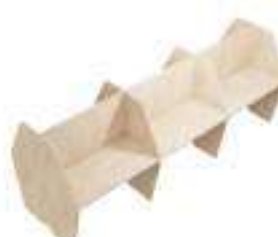
Composition 6 Dim : L. 368 x P. 130 cm