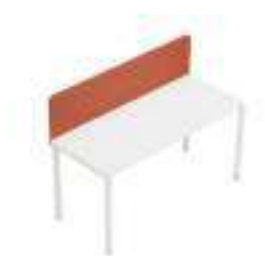
Composition 1 Dim : L. 140 x P. 60 cm

AGILE est une collection de bureaux, bench et tables de réunion aux lignes simples et géométriques. Ce concept a été créé en pensant que le travail d'équipe stimule la créativité, favorise la connaissance et l'échange culturel. AGILE répond donc à l'aménagement de lieux dédiés qui encouragent la collaboration et l'interaction pour partager et transférer les connaissances.