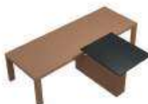
Composition 4 Dim : L. 328 x l. 250 x H. 67/130 cm