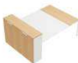
Composition 7 Dim : L. 240 x P. 160 cm