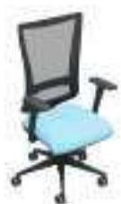
Composition 3 Dim : L. 65 x P. 52 x H. 44/102 cm