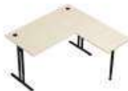
Composition 2 Dim : L. 160 x l. 160 x H. 64/86 cm