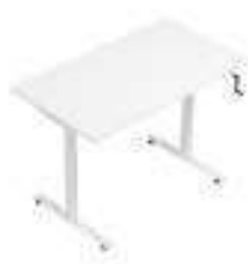
Composition 1 Dim : L. 140 x P. 80 x 65/130 cm

Les bureaux OGI DRIVE conviennent à différents types d'environnements. Des postes individuels aux espaces de coworking, les structures réglables permettent d'ajuster le mobilier à la morphologie de chaque utilisateur. Pour un budget maîtrisé, ce modèle existe en deux versions : manivelle ou électrique.