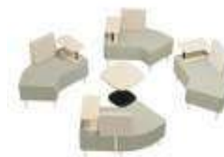
Composition 8 Dim : L. 121 x l. 60 x H. 45/80 cm (x4)

Retrouvez toutes les finitions disponibles de cette gamme sur www.spaceplanning.fr