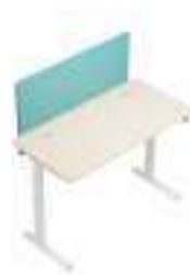
Composition 2 Dim : L. 160 x P. 80 x H. 65/125 cm