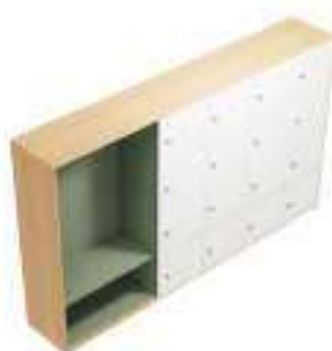
Composition 4 Dim : L. 273 x P. 45,4 x H. 157 cm