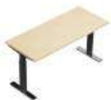
Composition 1 Dim : L. 140 x P. 60 x H. 65/130 cm

WINGLET est le système le plus avancé pour des espaces de haute efficacité ergonomique. Il possède une structure télescopique reconfigurable dans trois dimensions, pour permettre à l'utilisateur de changer fréquemment de position, ce qui lui évite de rester assis pendant plusieurs heures de suite.