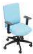
Composition 2 Dim : L. 65 x P. 62 x H. 46/92 cm