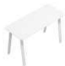
Composition 1 Dim : L. 140 x P. 60 cm

Un défi qui devient très vite une réalisation d'avant-garde technique et de style.