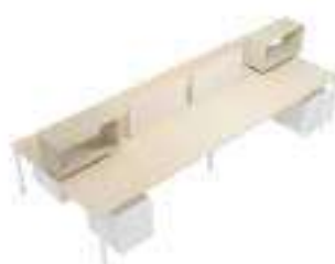
Composition 5 Dim : L. 400 x P. 163 cm