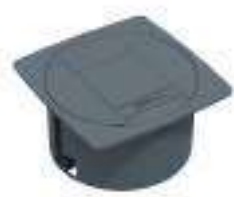
Composition 1 Dim : L. 11 x l. 11 x H. 0,25/5,7 cm

Légère et discrète, UNIT est la solution de base à la connectivité électrique et multimédia d'un poste de travail.