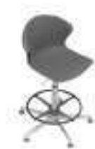
Complément 7 Dim : L. 43 x P. 50 x H. 65 cm