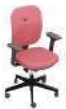
Composition 3 Dim : L. 68 x P. 59 x H. 48/102 cm