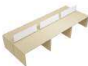
Composition 7 Dim : L. 420 x P. 160 cm