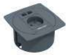
Composition 5 Dim : L. 11 x l. 11 x H. 0,25/5,7 cm