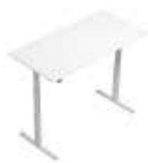
Composition 3 Dim : L. 160 x P. 80 x H. 61,8/126,8 cm