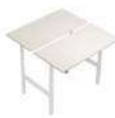
Composition 4 Dim : L. 160 x P. 168 x H. 60,2/125,2 cm