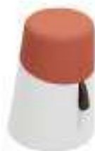
Composition 2 Dim : \varnothing 38/32 x H. 51 cm