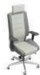
Composition 1 Dim : L. 68 x P. 60 x H. 48/127 cm

AZKAR est un fauteuil à l'ergonomie avancée et proposant un confort absolu, spécialement conçu pour des postes de travail à usage intensif de type 3 x 8 et pour les utilisateurs avec des problèmes de lombalgie. Étudié pour accueillir des gabarits importants, ce fauteuil de conception extrêmement robuste offre toutes les options de réglages pour un confort personnalisé et permet d'obtenir des positions de relax très inclinées.