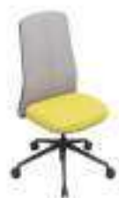
Composition 5 Dim : L. 53 x P. 53 x H. 47/105 cm