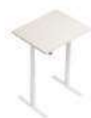
Composition 1 Dim : L. 100 x P. 80 x H. 61,8/126,8 cm

Le modèle de bureau UP&UP est conçu pour le bien-être des personnes au travail : la hauteur du plateau est réglable grâce à un mécanisme automatique, permettant de changer de position tout au long de la journée et même de travailler debout, pour favoriser la circulation et éviter les efforts excessifs sur la colonne vertébrale.