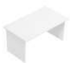
Composition 1 Dim : L. 140 x P. 80 cm

Le bureau intemporel IDEA+ côtoie le style classique et contemporain. Son pied panneau lui permettra de rester élégant dans le temps.