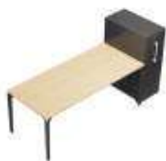
Composition 5 Dim : L. 220 x P. 80 cm