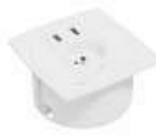
Composition 6 Dim : L. 11 x l. 11 x H. 0,25/5,7 cm