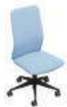
Composition 1 Dim : L. 53 x P. 55 x H. 49/100 cm

La chaise de bureau au design moderne et fonctionnel. Disponible avec arrière dossier noir, blanc ou entièrement rembourré découvrez une chaise exceptionnelle pour rendre votre environnement de travail unique.