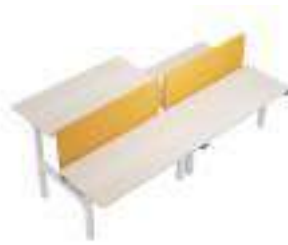
Composition 6 Dim : L. 320 x P. 160 x H. 65/130 cm