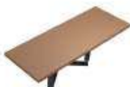
Complément 6 Dim : L. 300 x P. 120 x H. 75 cm