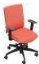
Composition 1 Dim : L. 65 x P. 62 x H. 46/92 cm

Passez une journée de travail dans la détente grâce à un équipement ergonomique intégral de la gamme @JUST EVO. Le dossier capitonné tridimensionnel et souple suit de façon flexible les mouvements de la personne assise sur les côtés. L'élasticité matérielle particulière du dossier en polyamide confère à la position assise une toute nouvelle dimension.