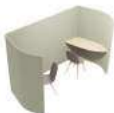
Composition 5 Dim : L. 296 x P. 138 x H. 175 cm