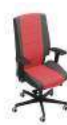
Composition 5 Dim : L. 68 x P. 60 x H. 48/113 cm