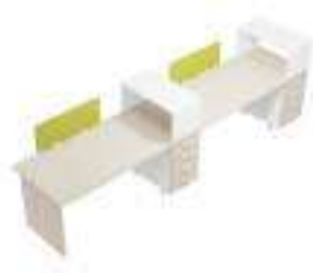
Composition 5 Dim : L. 364 x P. 80 cm