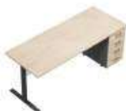
Composition 4 Dim : L. 200 x P. 80 cm