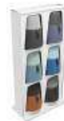
Composition 9 Dim : L. 106 x P. 55 x H. 199 cm