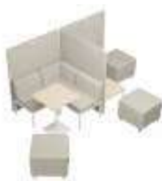
Composition 5 Dim : L. 245 x l. 123 x H. 45/140 cm