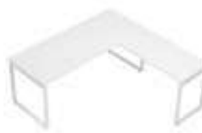
Composition 4 Dim : L. 200 x P. 200 cm