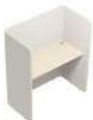
Composition 3 Dim : L. 117 x P. 65 x H. 135 cm