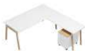
Composition 5 Dim : L. 180 x P. 200 cm