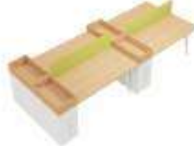
Composition 6 Dim : L. 404 x P. 160 cm