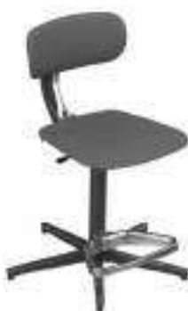
Composition 1 Dim : L. 41 x P. 43 x H. 52/85 cm

Conçu pour être placé devant les bureaux réglables en hauteur, EGOKI est un siège ergonomique idéal pour alterner les stations assis, assis debout et debout. Il est équipé d'un dossier tapissé réglable en hauteur et en profondeur pour un soutien lombaire optimum et personnalisé. La partie avant de son assise tapissée est flexible pour éviter toute compression sanguine et musculaire.