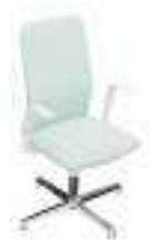
Composition 5 Dim : L. 61 x P. 55 x H. 49/100 cm