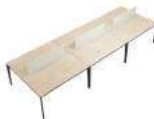
Composition 8 Dim : L. 480 x P. 164 cm

Retrouvez toutes les finitions disponibles de cette gamme sur www.spaceplanning.fr