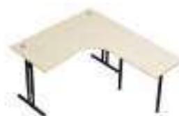
Composition 4 Dim : L. 160 x l. 190 x H. 64/86 cm