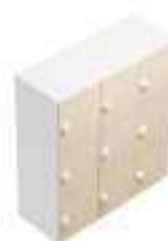
Complément 8 Dim : L. 117 x P. 46 x H. 119 cm

Retrouvez toutes les finitions disponibles de cette gamme sur www.spaceplanning.fr