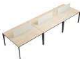
Composition 7 Dim : L. 420 x P. 124 cm