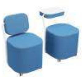
Composition 3 Dim : L. 49 x l. 54 x H. 50 cm