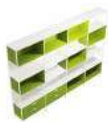
Composition 6 Dim : L. 230 x P. 40 x H. 213 cm