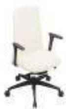
Composition 1 Dim : L. 63 x P. 53 x H. 47/102 cm

Ses caractéristiques ergonomiques particulières rendent ce siège parfait pour tout type de poste de travail, des cadres et semi-cadres aux postes de travail, tandis que de nombreuses options de personnalisation permettent de l'ajouter à des intérieurs de styles et de goûts différents.