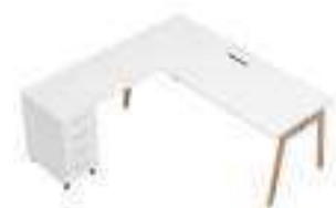
Composition 6 Dim : L. 200 x P. 200 cm