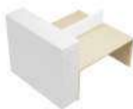
Composition 5 Dim : L. 200 x P. 160 cm