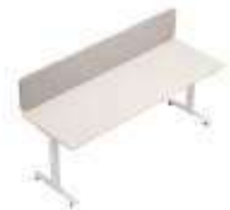
Composition 3 Dim : L. 200 x P. 70 x 65/130 cm