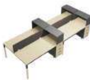
Composition 6 Dim : L. 404 x P. 164 cm