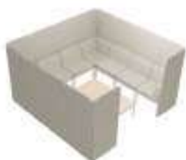
Composition 7 Dim : L. 246 x P. 246 x H. 45/140 cm