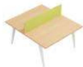
Composition 3 Dim : L. 140 x P. 160 cm