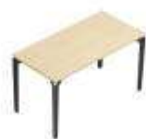
Composition 1 Dim : L. 120 x P. 60 cm

La gamme de bureaux design PARIS donne du cachet et une grande modularité aux espaces de travail. Disponible en poste de travail individuel ou face-à-face, avec piètement simple ou partagé, cette collection s'adapte aussi bien aux bureaux simples que collectifs, en flex office ou open space.