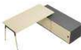
Composition 6 Dim : L. 224 x P. 181 cm