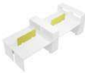
Composition 6 Dim : L. 404 x P. 160 cm