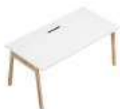
Composition 3 Dim : L. 160 x P. 80 cm