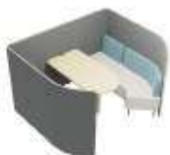
Composition 7 Dim : L. 225 x P. 190 x H. 135 cm