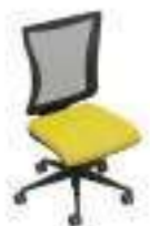
Composition 1 Dim : L. 52 x P. 52 x H. 44/96 cm

Le fauteuil de bureau pivotant KUPER EASY MESH est disponible avec structure blanc ou noir, dossier haut ou bas en résille, différentes solutions d'accoudoirs, de mécanismes et de piètements pour répondre à toutes vos exigences.