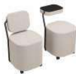
Composition 4 Dim : L. 49 x l. 54 x H. 50 cm