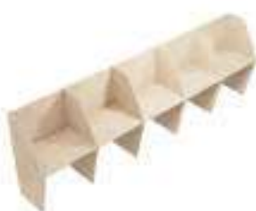
Composition 7 Dim : L. 412 x P. 65 cm