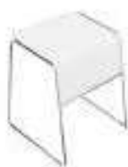
Composition 1 Dim : L. 67 x P. 66,5 x H. 72 cm

Idéale pour les établissements scolaires, de formations et les entreprises, la table TUTOR représente une solution polyvalente et multi-fonctionnelle de classe mondiale pour les environnements exigeants et soucieux du design.