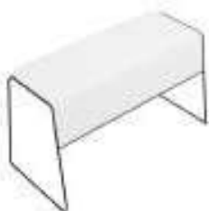
Composition 5 Dim : L. 139 x P. 66,5 x H. 72 cm