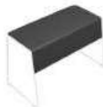
Composition 4 Dim : L. 127 x P. 66,5 x H. 72 cm