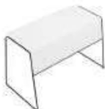
Composition 3 Dim : L. 127 x P. 66,5 x H. 72 cm