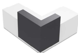
Composition 3 Dim : L. 210 x P. 190 cm