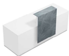
Composition 1 Dim : L. 220 x P. 84 cm

La gamme LUX représente la plus grande expression d'élégance pour la réception. Elle est personnalisable avec des finitions de qualité, comme le Fenix et la vitrocéramique, ce qui lui donne un aspect chic et raffiné.