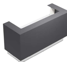
Composition 2 Dim : L. 220 x P. 84 cm