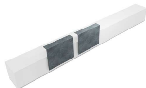
Composition 5 Dim : L. 760 x P. 84 cm